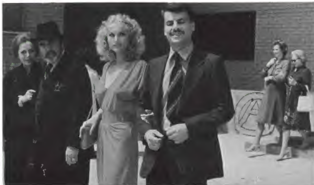
Margot Cottens - Antonio Ferrandis - Barbara Bouchet - Michele Plácido